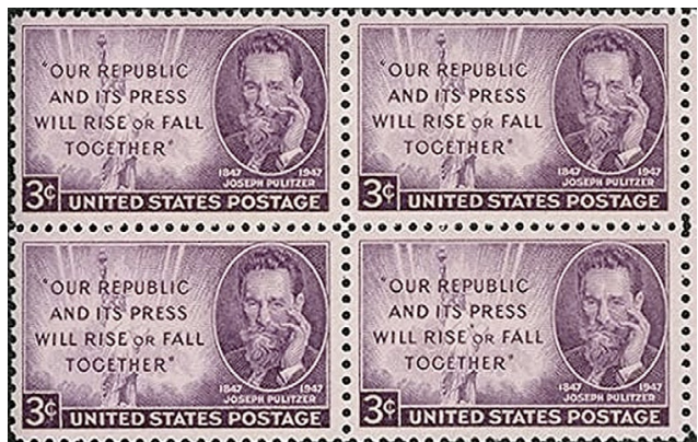
L'appel de Joseph Pulitzer dans la North American Review en 1904 commémoré par la poste américaine (1947).

Eh bien... qui, par exemple, présentent les différentes faces d'un sujet sans axiologie sous-jacente opposant a priori des bons et des méchants.