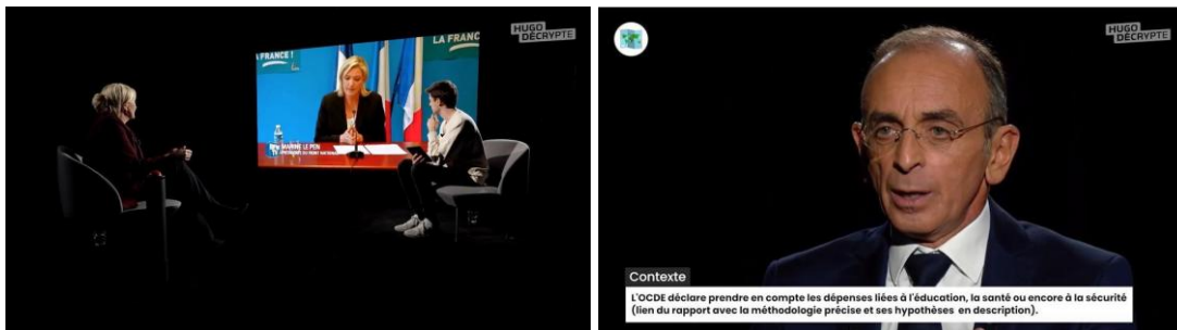
Illustration 2. Marine Le Pen confrontée à des propos tenus en 2016 (16mn15)

Un dernier élément de l'interview, qui constitue une innovation permise par la diffusion en différé, est l'incrustation de textes brefs en bas de l'écran. Dans la majorité des cas, il s'agit de données factuelles ou de définitions qui viennent expliciter les propos de l'interviewé, voire de l'intervieweur (deux pour MLP, 10 pour EZ). Ces compléments d'information contribuent à la mission pédagogique que se donne HT. À trois reprises dans chaque interview, des éléments factuels contredisent les propos de l'invité, en complément de ce qu'énonce HT (illustration 3). Significativement, ils sont utilisés au cours des séquences les plus adversiales des interviews (séquences 1 et 5 pour MLP, 2b pour EZ) et signalés par les flèches « i » sur la figure 1 A et B. Par cet ajout postérieur à l'interview auquel l'invité n'a pas la possibilité de répondre, HT s'assure là encore d'avoir le dernier mot.